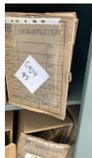
WhatsApp Image 2026-04-23 at 12.25.44 PM.jpeg 174K